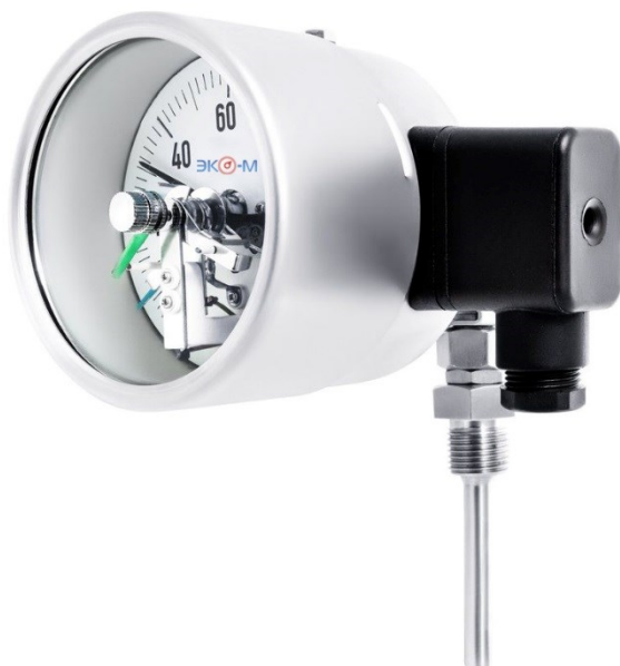
БТ-4 (с электроконтактным устройством)