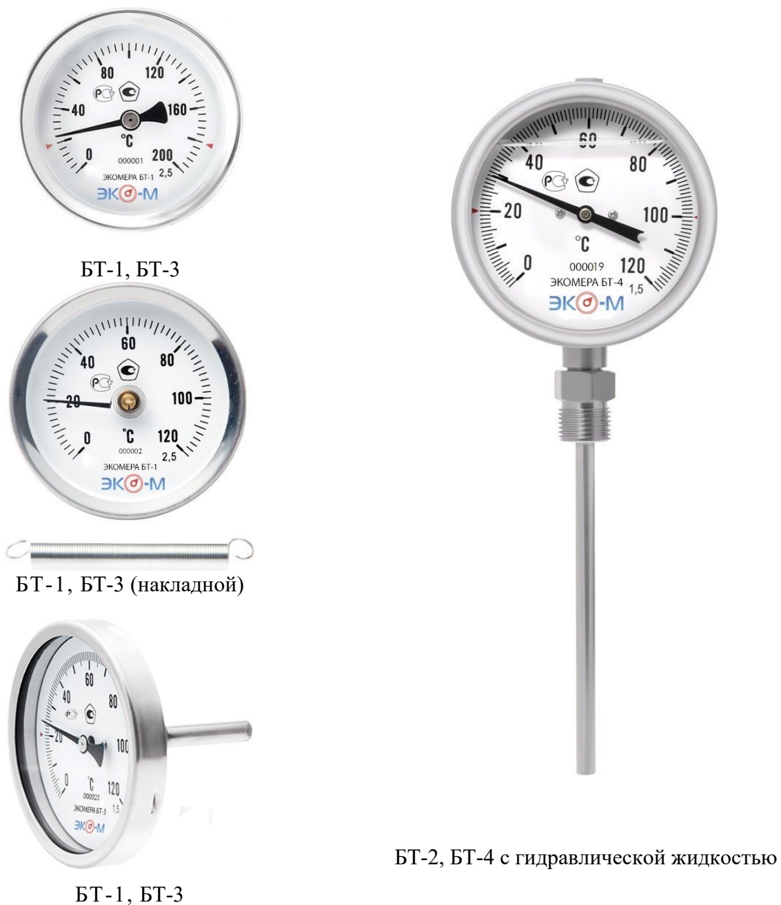
Рисунок 2 – Общий вид термометров биметаллических ЭКОМЕРА БТ