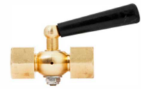
Кран трехходовой ЭКОМЕРА G1/2F-M20*1,5F KTX-GF-MF 687₽