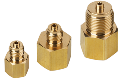
Переходники латунные ПЛ