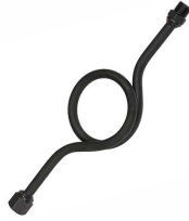
Петлевая трубка, прямая