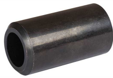
Бобышка варная, L=55мм