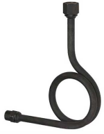
Петлевая трубка, угловая