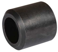
Бобышка варная, L=30мм