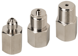
Переходники коррозионностойкие ПН